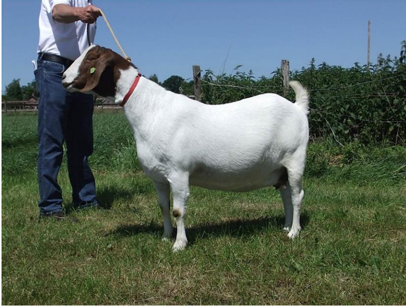
Billy 1 op de verenigingskeuring 2015 in Gilze.

De hoogst opgenomen bok werd Knoalster Jacob (V: Knoalster Ido) van de fam. Kupers uit Nieuwe Pekela. Hem werd de volgende waardering toegekend: AV 89, TY 90, ONTW 88, BW 87 en BESP 89 (zie foto).